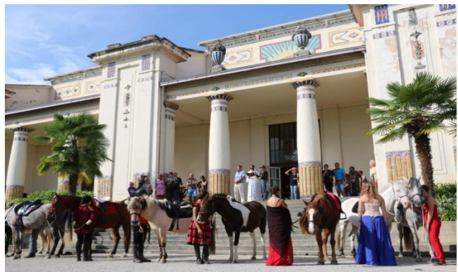
(Archives de la parade avec bénédiction de Follement Cheval 2019 à Salies-du-Salat)